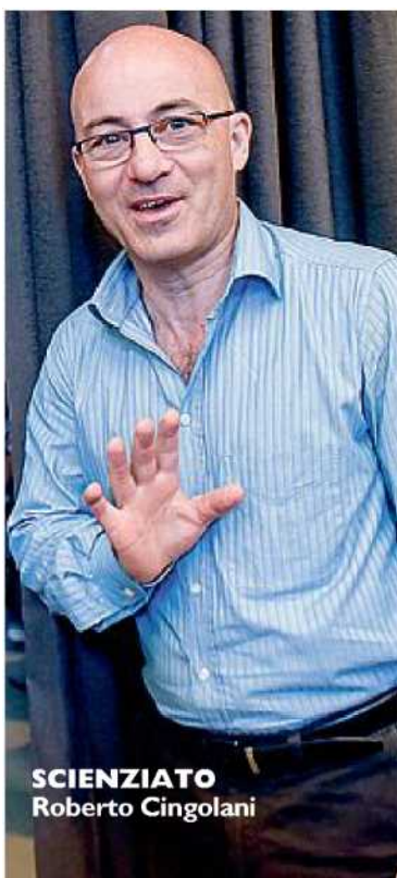
SCIENZIATO Roberto Cingolani